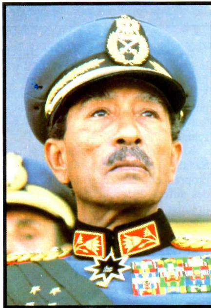
Anouar el-Sadate — 1918-1981

Après la victoire alliée, Sadate se remit à comploter contre la domination des Britanniques en Egypte et contre leurs partisans égyptiens. Il fut incarcéré à deux reprises pour avoir été impliqué dans des projets