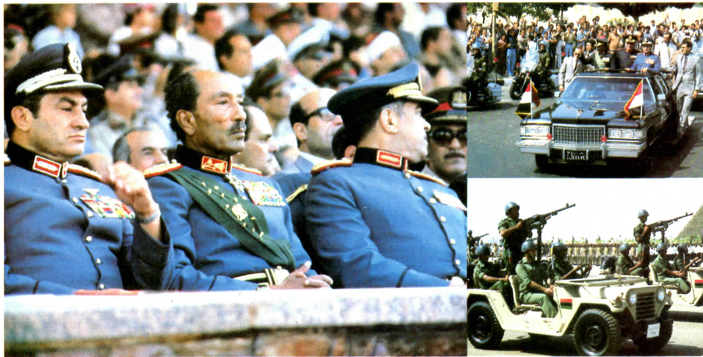
QUELQUES INSTANTS AVANT SON ASSASSINAT , le président égyptien Anouar el-Sadate est assis dans la tribune officielle, entouré du Vice-Président Hosni Moubarak et du général Abdel Halim Abou Ghazala, ministre de la Défense. En vignette: l'arrivée de M. Sadate au lieu du défilé, dans sa limousine (en haut). Des soldats égyptiens, en défilé militaire, présentant leur armement (en bas).

cap pour détacher l'Égypte de l'Union soviétique et l'orienter vers les États-Unis. Il s'agissait là d'une rupture radicale avec la position pro-soviétique adoptée de longue date par Nasser. Sadate écrivit plus tard: "Je voulais faire savoir au monde entier que nous sommes toujours nos propres maîtres."